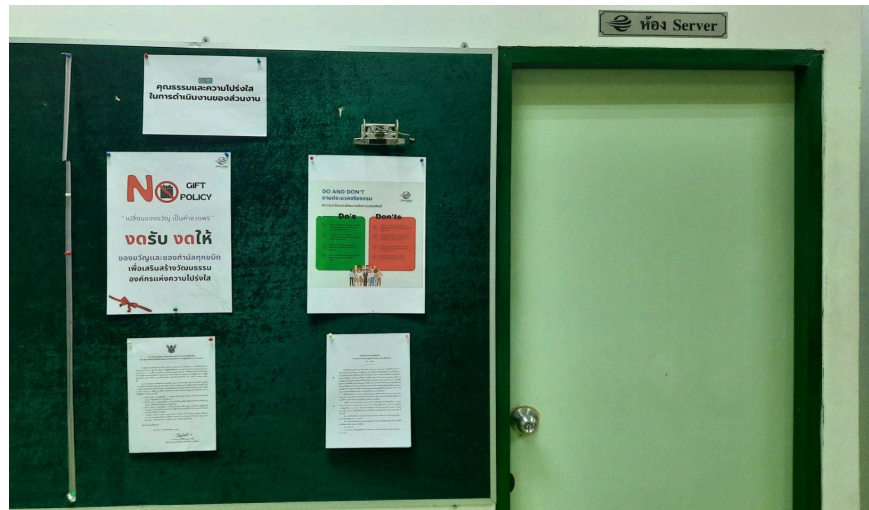
บอร์ดประชาสัมพันธ์ ฝ่ายบริการวิชาการ