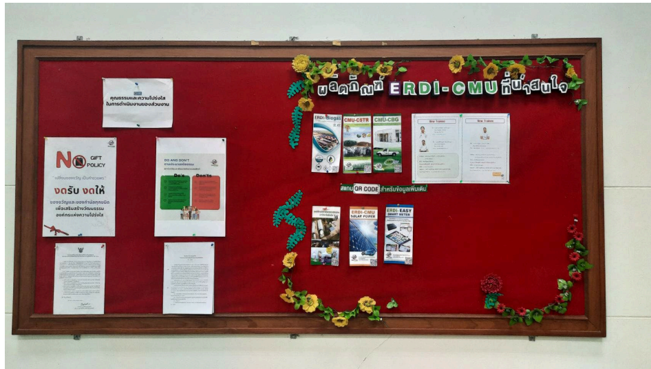
บอร์ดประชาสัมพันธ์บริเวณโถงชั้น 1