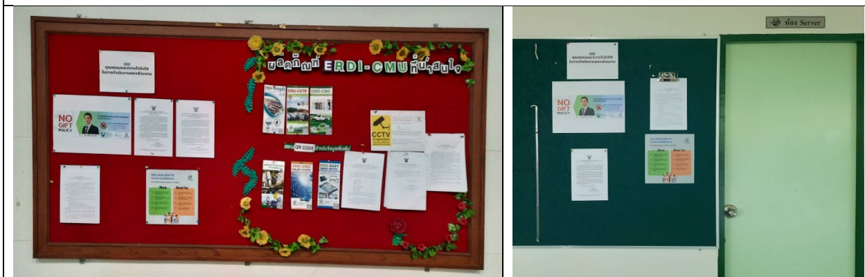
บอร์ดประชาสัมพันธ์บริเวณโถงชั้น 1 และบอร์ดประชาสัมพันธ์ ฝ่ายบริการวิชาการ